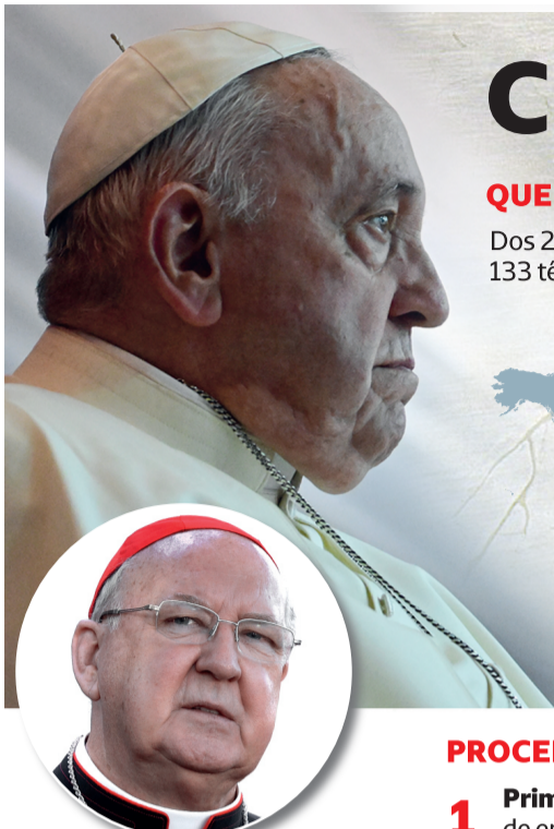
Kevin Joseph Farrell: Cardeal camerlengo, coordena todo o processo de eleição